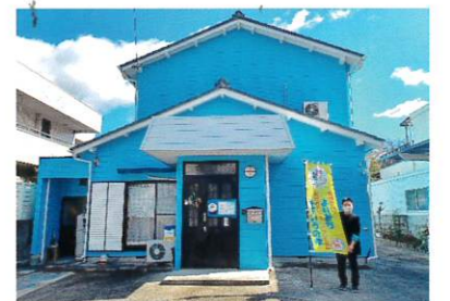
⑬ カフェ みずいろの家