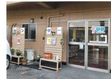
⑩ 日曜ゆめちサロン