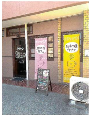
④ カフェドアゲイン