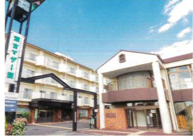
② マザーカフェおきらく