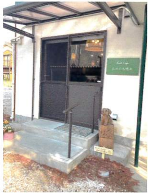
⑤ Knit café あめのち晴れ