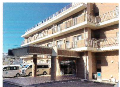
⑥ 道草カフェ 「オレンジのMori」