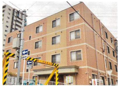
① ケアカフェ なごみ

日程などが変わることがあります。参加を希望される方は、あらかじめ①～⑬の各主催団体、または、いきいき支援センターへお問い合わせください。