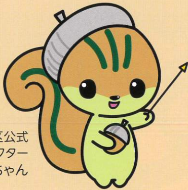
守山区公式 マスコットキャラクター モリスちゃん

認知症カフェは、認知症のご本人やご家族、地域住民、専門職など、認知症に関心のある誰もが気軽に集まり、仲間づくりや情報交換を行う拠点です。