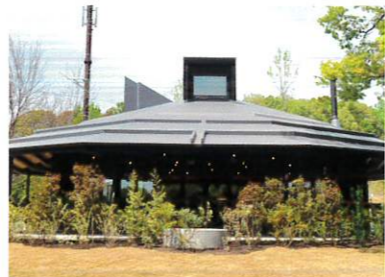
⑧ 認知症カフェ マメボン