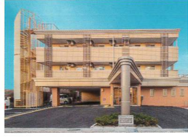
③ 瀬古の家 グリーンCafe