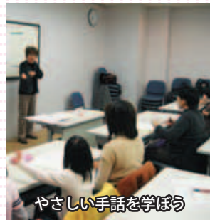
やさしい手話を学ぼう