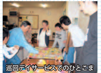
巡回デイサービスでのひとこま

また、社会福祉協議会を会場にして、他にも様々な催しが開かれています。それぞれの開催日等はお問い合わせください。