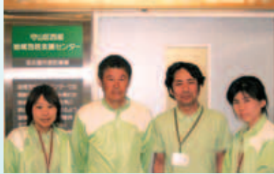
守山区西部地域包括支援センター