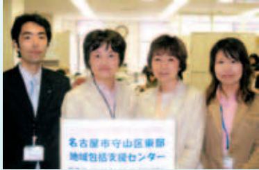
守山区東部地域包括支援センター

地域包括支援センターでは、社会福祉士、主任介護支援専門員、保健師、看護師などが配置され、高齢者の方が住みなれた地域で安心して生活ができるように、介護予防事業や相談などを行います。