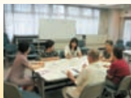
社協だより編集会議の様子

この『社協だより』の紙面づくりにご協力いただけるボランティアの方を募集しています。(紙面の内容の検討、地域の福祉施設やボランティアグループなどの取材) ご自分の住む地域に興味や関心のある方、文を書くのが好きな方などふってご応募ください。