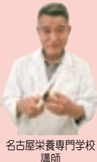
名古屋栄養専門学校 講師