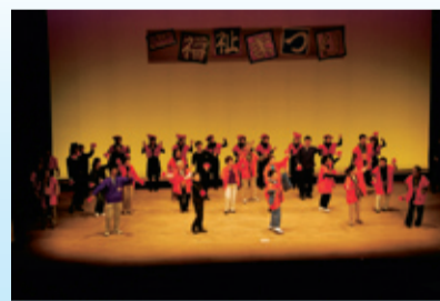
ステージ発表の様子