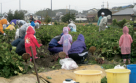
親子のふれあい行事