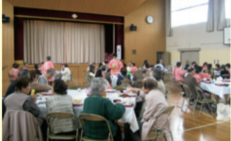
ひとり暮らし高齢者の給食会 など