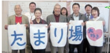
「たまり場」プロジェクトチームのメンバー

「たまり場」とは地域のみなさんが気軽に集い、交流を楽しむ仲間づくりの場です。閉じこもりを防ぎ、地域で生きがいをもっていきいきと暮らすことを目的とした活動で、「ふれあいいきいきサロン」ともよばれています。 “知り合うことから支え合うことへ”地域の福祉力を育てる住民活動として注目されています。守山区社会福祉協議会では第2次地域福祉活動計画の実施項目として、「たまり場」活動を支援し、増やすための取り組みをしています。現在、地域住民の方、関係機関にご協力いただき、プロジェクトチームを結成し活動中です!