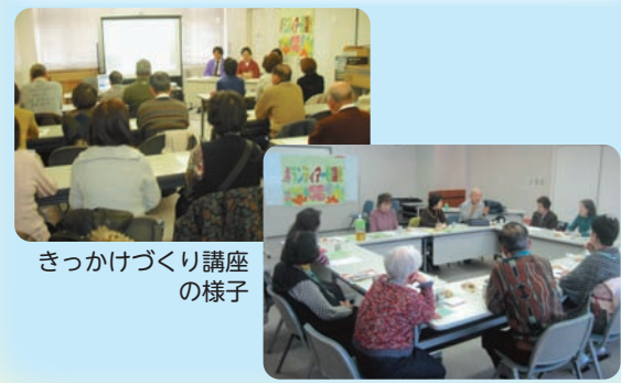
きっかけづくり講座の様子