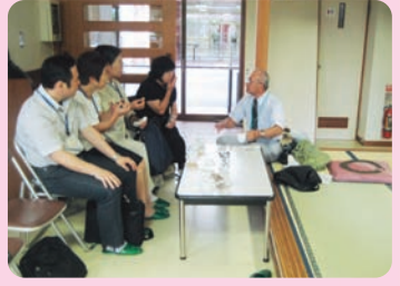
瀬古いきいきサロンでの調査の様子

新たなたまり場を増やすためにはどうしたらいいのか、チームCのメンバーでの6回にわたる定例会、3カ所のサロンへの訪問調査を通して、議論を重ね、下記の取り組みを行いました。