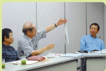
第2回意見交換会の様子

チームAメンバーでの7回にわたる定例会、サポーターとの意見交換会を通して、議論を重ね、下記の取り組みを行いました。