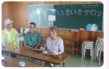
喜多山西いきいきサロンの様子

平成22年度新たに 6カ所のたまり場 が開設。平成23年度も既に 2カ所 開設予定。