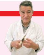
名古屋栄養専門学校講師