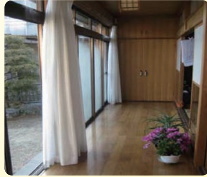
すみさん家の縁側

「すみさん家」では、地域の方々が集まれるような居場所をつくろうと、お部屋を使ってもらうことを考えてい