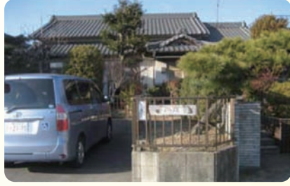
アットホームなたたずまい

訪問するきっかけとなったのは、社協だより編集ボランティアKさんから頂いた「すみさん家の笑顔側だより」という機関紙でした。この「笑顔側だ